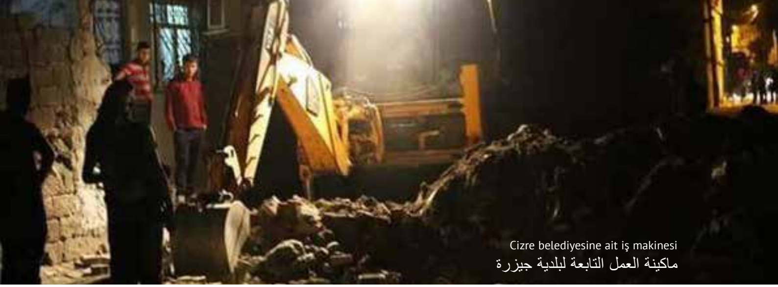
Cizre belediyesine ait iş makinesi ماكينة العمل التابعة لبلدية جيزرة